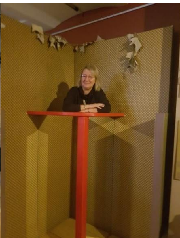
Brīnumu meklējot Tehnoannas pagrabos.