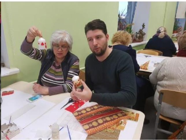
Darot mājāties domāt. Ziemassvētku Sveču dekopāžas darbnīca.