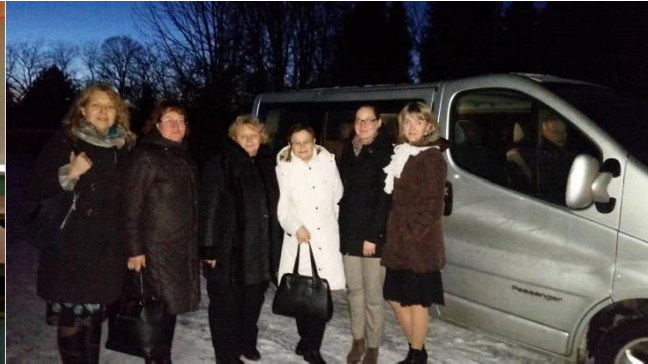
Foto no viesošanās Ogresgala pamatskolā