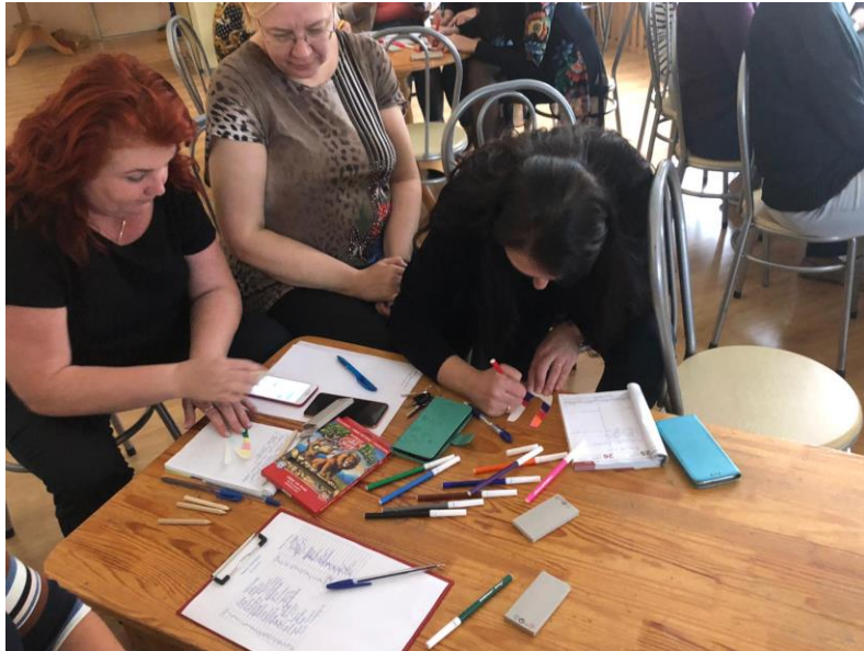
Attēlā Rīgas 234. pirmsskolas izglītības iestādes pedagogi