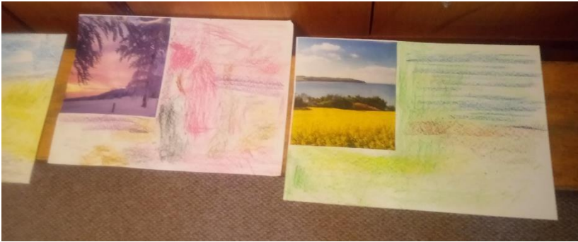
Bērnu vecums 4-5 gadi

Krāsu un krāsu toņu saskatīšanai pedagogi bērniem piedāvāja novietot darba lapas stūrī attēlu vai fotogrāfiju, attēlā saskatīt krāsas un krāsu toņus un līdzās attēlot novēroto krāsu spektru.