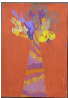
Bērna darbs – pretējo krāsu un toņu izmantošana gleznā.