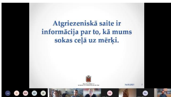
Darbņica "Skolotāju pieredzes apmaiņa. Atgriezeniskās saites veidi."