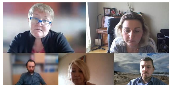
Grupus darbu darbnīcā “Skolotāju pieredzes apmaiņa. Atgriezeniskās saites veidi.”