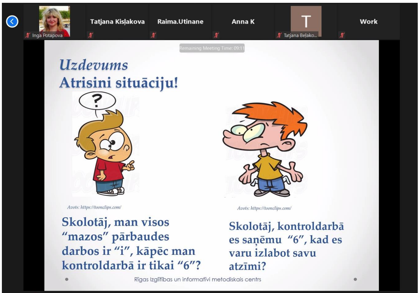
2.att. Diskusija par vērtēšanu un vērtējumu.