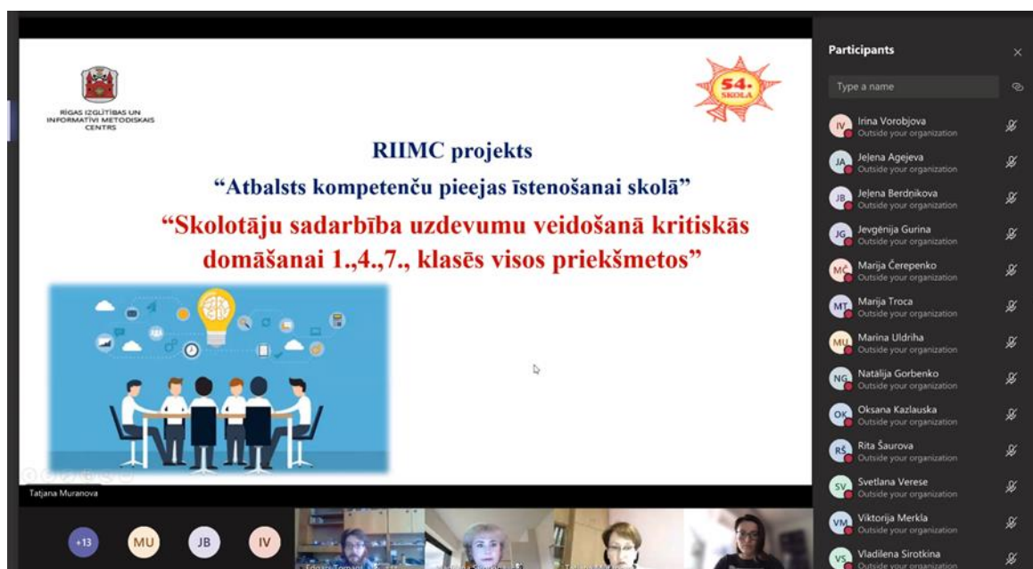
1.att. Ekrāna šāviņš no projekta pirmās aktivitātes 30.11.2020.

Otrā projekta aktivitāte: praktiskais seminārs “ Mācīšana iedziļinoties ” tika organizēts 3 posmos: