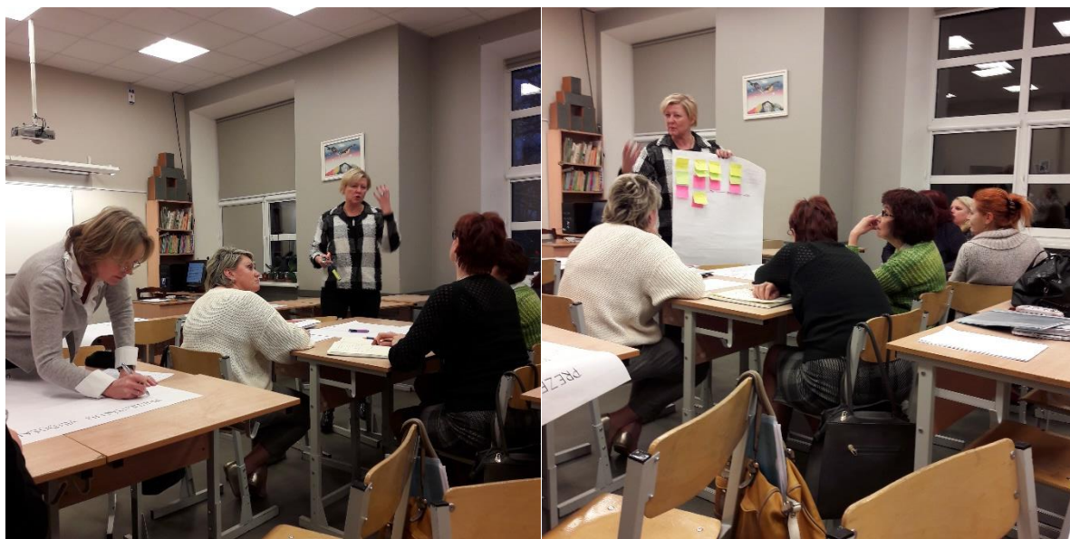
2.attēls. Mācības vadošajiem pedagogiem

Skolas pedagogiem, kopā sadarbojoties, gūtas vērtīgas atziņas un praktiskas idejas turpmākajam pedagoģiskajam darbam, lai skolēni gūtu dzīvei 21. gadsimtā nepieciešamās zināšanas, prasmes un attieksmes (3.attēls). Kopumā horizontālās sadarbības nodarbībās iesaistījušies 63 pedagogi.