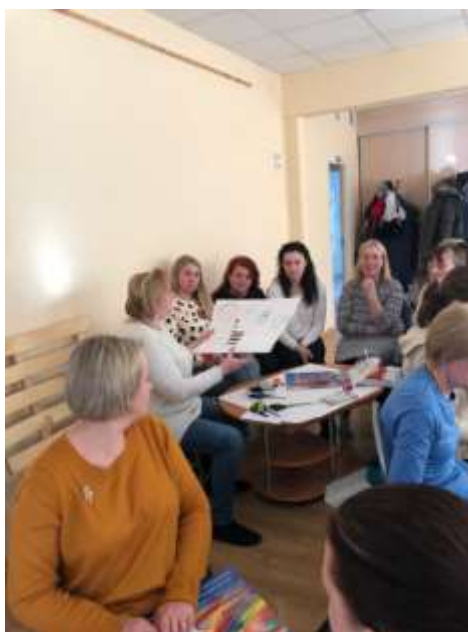
5. att. Pedagogi prezentē idejas

Apkopotās idejas fiksēja plakāta lapās un prezentēja pārējām grupām.