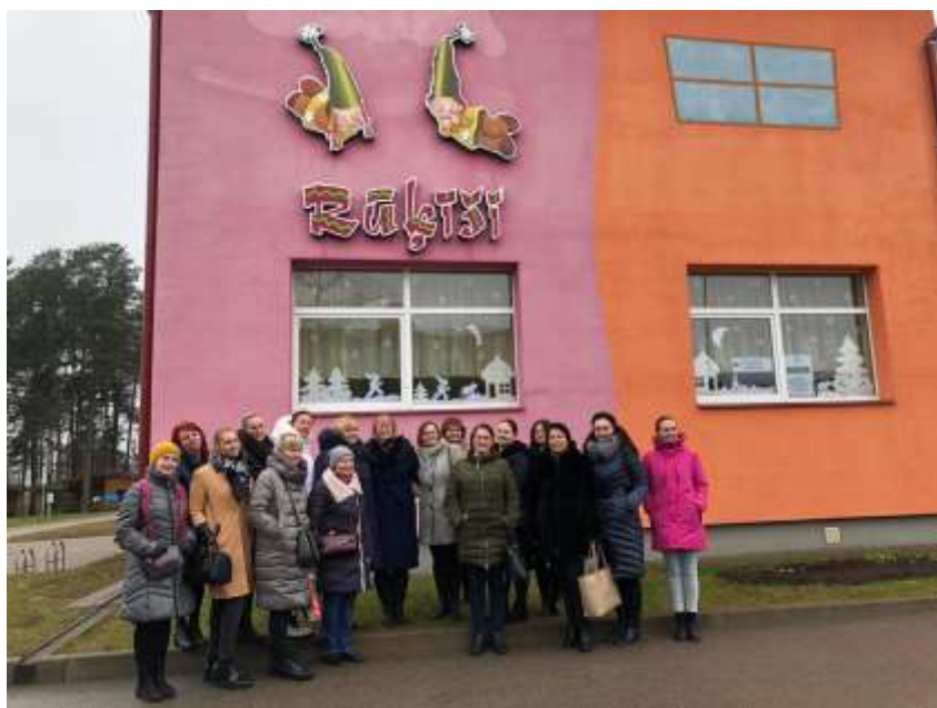
1.att. Pie Līvānu pirmsskolas izglītības iestādes „Rūķīši”