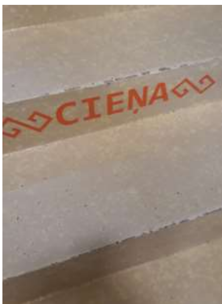
2. att. informācijas izvietošana uz trepju pakāpiena malas