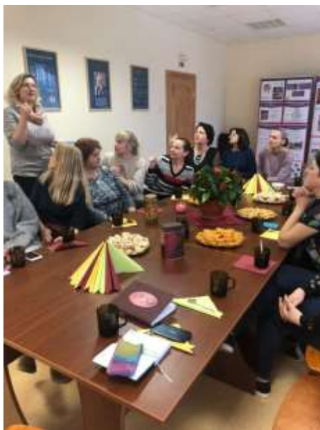
3. att. Aktīvas diskusijas par redzēto Līvānu „Rūķišos”