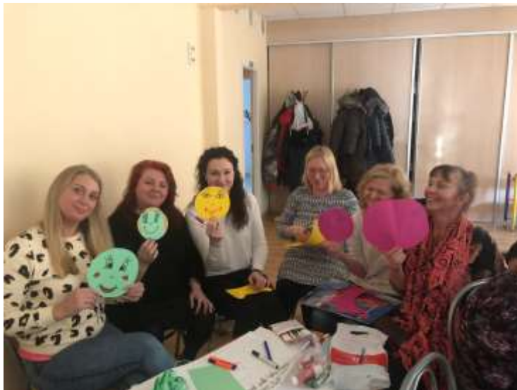
7. att. Mūsu pedagogi

Kopīgi mācoties mēs iegūstam daudz jaunu ideju, apliecinājumu savam darbam un pozitīvas emocijas! Lai mums visiem izdodas!