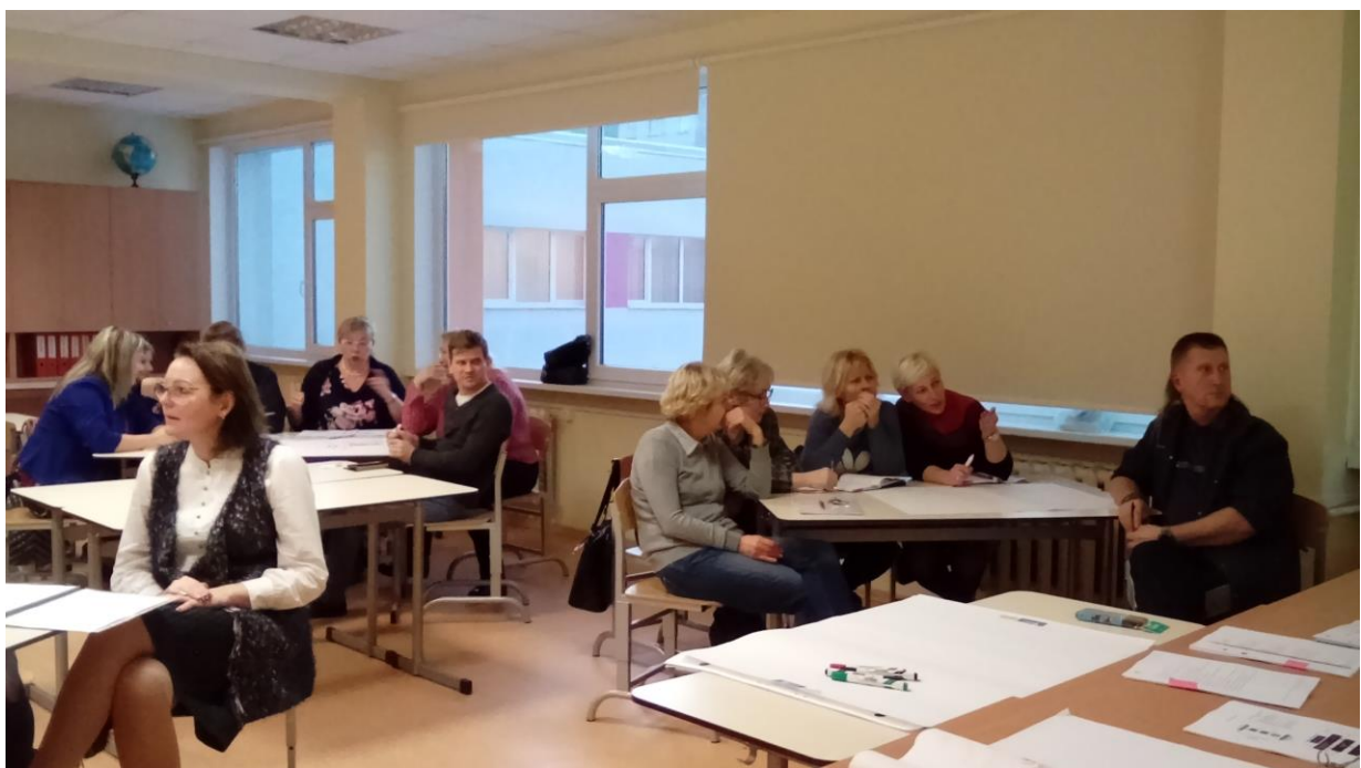
3.attēls. Diskusija par atgriezeniskās saites paņēmieniem.

Trešajā nodarbībā skolotāji uzzināja par iespēju skolēniem saņemt atbilstošu atgriezenisko saiti mācību stundā un mācību procesā mācību darba uzlabošanai, kā veidot snieguma līmeņu aprakstu un kā iesaistīt skolēnus savu sasniegumu izvērtēšanā. Pedagogi modelēja mācību stundas, izmantojot dažādus formatīvās vērtēšanas un atgriezeniskās saites paņēmienus. Mācīšanās nav iespējama bez sadarbības, tāpēc skolotāji piedalījās lomu spēlē, mācījās sniegt atgriezenisko saiti kolēģim.