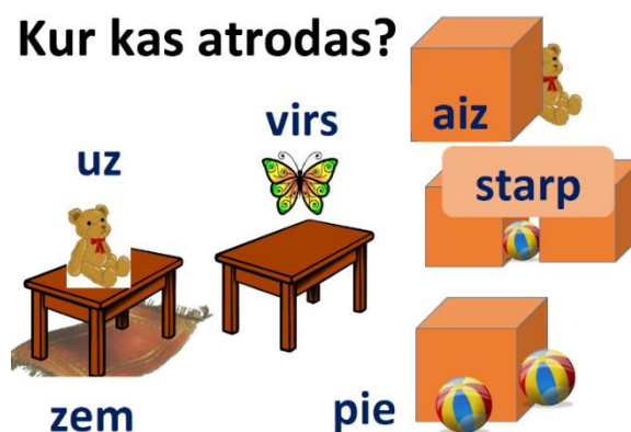
1.un 2. att. "Runājošā siena" franču valodas priekšmetam, autore Anna Ņikitina un latviešu valodas priekšmetam, autore Olga Sļadevska