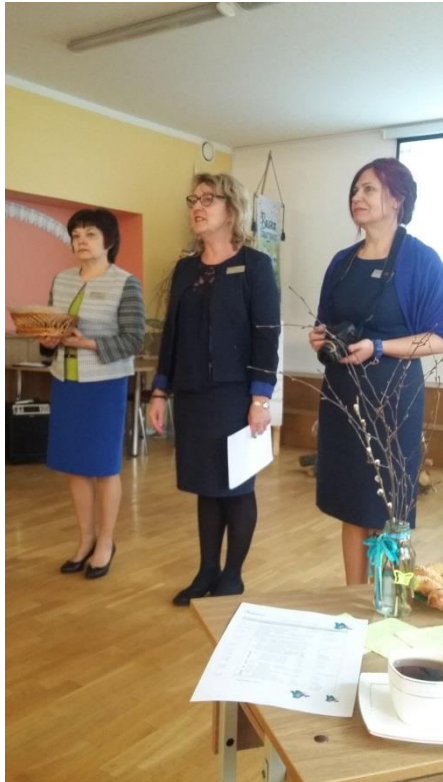
Bauskas sākumskolas komanda