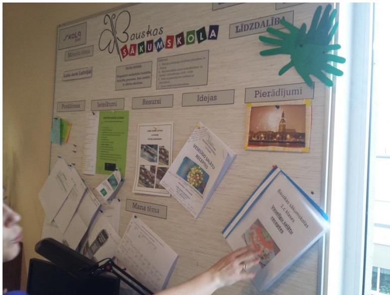
Bauskas sākumskolas projekta siena