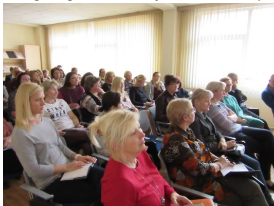
Kursu 1. daļa.

Kursu nodarbības tika organizētas divās daļās - pirmajā daļā, kur piedalījās visi izglītības iestādes pedagogi, lektore dalījās pieredzē un informācijā par pedagogu sadarbības svarīgo lomu gan ikdienas darbā, gan domājot par jaunā izglītības satura ieviešanu. Savukārt, kursu otrajā daļā gan 26., gan 27. martā, no katras metodiskās komisijas piedalījās trīs pedagogi t.i. metodiskās komisijas vadītājs un divi skolotāji, kuri ir gatavi kursos apgūto izmēģināt praktiski, tādējādi veicinot dziļāku un plašāku pedagogu sadarbību skolā.