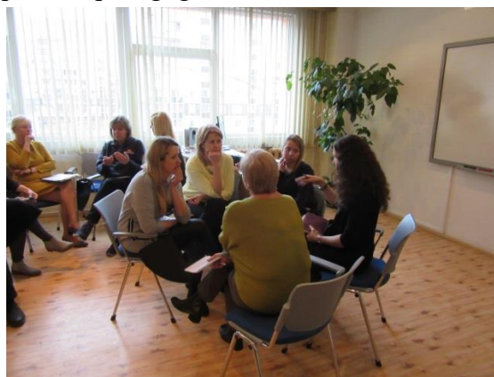
Kursu 2. daļa.

Kursu laikā daudz tika diskutēts un iegūta izpratne par to, kas mūs sagaida tuvākajā laikā, ieviešot jauno izglītības saturu skolā. Aktivitātes tika organizētas divos veidos – teorētiski un praktiski.