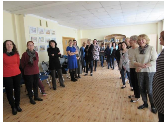
Kursu dalībnieki aktivitātes laikā.

Lektore, ar kuru mums veiksmīga sadarbība jau bijusi vairākkārtīgi, piedāvāja gan teorētiskas zināšanas, gan praktisku darbošanos.