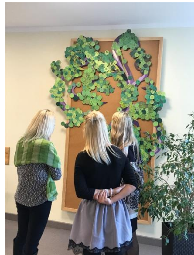
Nodarbības dalībnieki iepazīstas ar skolas simbolu.