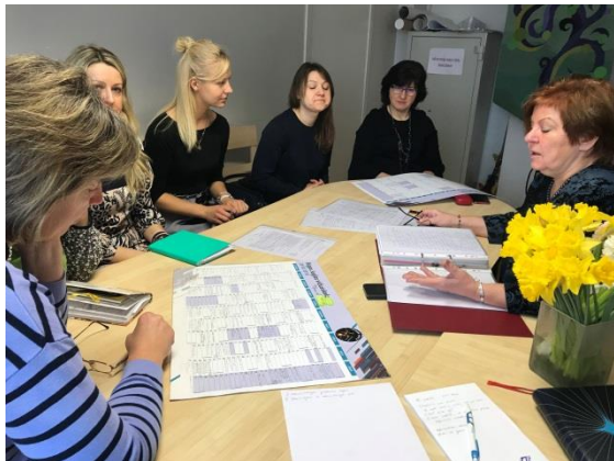
Kursu dalībnieki aktivitātes laikā – sadarbības

Nodarbības laikā redzējām, kā realitātē notiek skolotāju sadarbība citā Rīgas skolā. Tikām iepazīstināti ar labās prakses un starppriekšmetu sadarbības piemēriem. Interesants likās brīvprātības princips, kas pieļauj skolotājam izvēlēties piedalīties vai nepiedalīties kādā aktivitātē, kā organizēt pašizglītošanās iespējas.