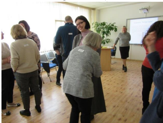
Kursu dalībnieki aktivitāšu laikā.

Citi ar lielāku, citi ar mazāku entuziasmu metās uzdevumu izpildē, jo dažs uzdevums lika izkāpt no ierastās domāšanas un komforta zonas (piem. 3 minūtes stāstīt par pirkstu, kamēr otrs kolēģis to filmē).