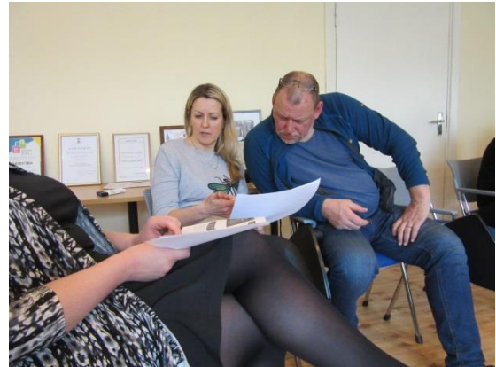
Metodisko komisiju darba grupas analizē citu skolu labās prakses piemērus pedagogu sadarbības jautājumos.

Ieguvām pieredzi un pārliecību par to, ka skolotājiem savā starpā ir jāsadarbojas, lai nodrošinātu skolēniem jēgpilnu un aizraujošu mācību procesu. Kā vienīgais šķērslis tika saredzēts – laika trūkums.