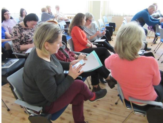
Kursu dalībnieki aktivitātes laikā – sadarbības veidošana veicot uzdevumu mobilās aplikācijas vidē.